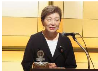
フォーラム:花苑委員長