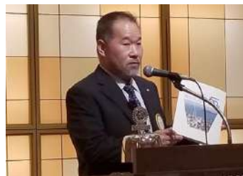
50周年記念誌が出来ました