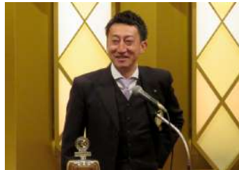
低田会員が会長ノミニーに