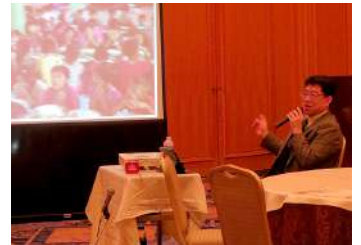
吉岡会員から報告