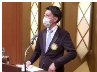
低田会長エレクト報告