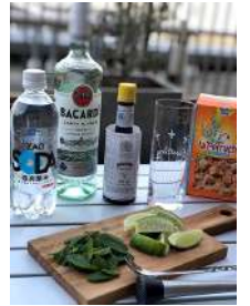
奥左から炭酸水、ホワイトラム、アンゴスチュラビターズ、カソナード、まな板の上は、ミントとくし型切りライム