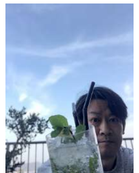
最近、仕事の都合をつけられず欠席が続いて申し訳ありません。皆様に忘れられないように顔写真upします。自撮りは恥ずかしい。