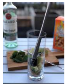
ライムをペストルで潰します