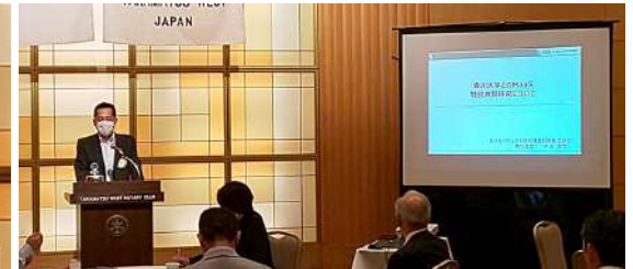
誕生日卓話 平池会員