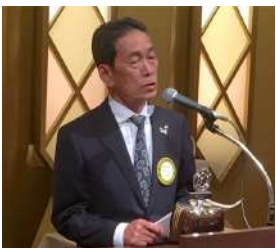
島谷直前会長より