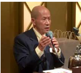
高関ガバナー補佐