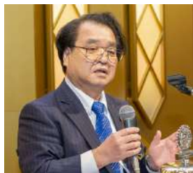
篠原徹ガバナー講評