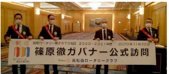
横断幕でガバナーをお出迎え