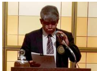
出席報告サン会員