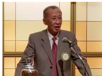
卓話：「地方経済の未来について」小竹会員